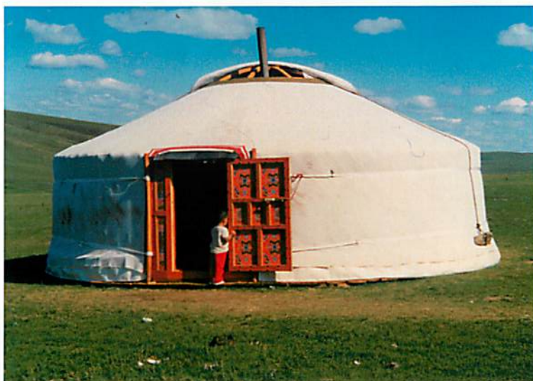
遊牧民の天幕 ゲル