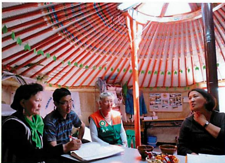
TCDC内で（エコグループの人々）