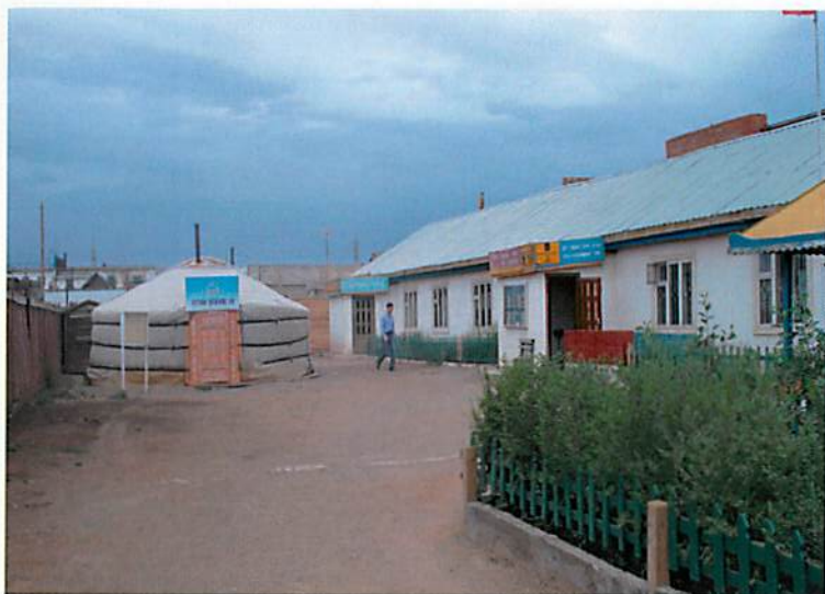
トルゴイト地域開発センター（TCDC）のゲル事務所